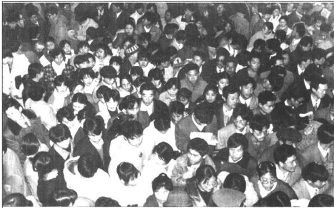
(上) 爆满的洽谈大厅一角。(左中) 企盼被录用的大学毕业生。(左下) 为孙子谋职当参谋的老两口。(右下) 期冀再就业的下岗女工。